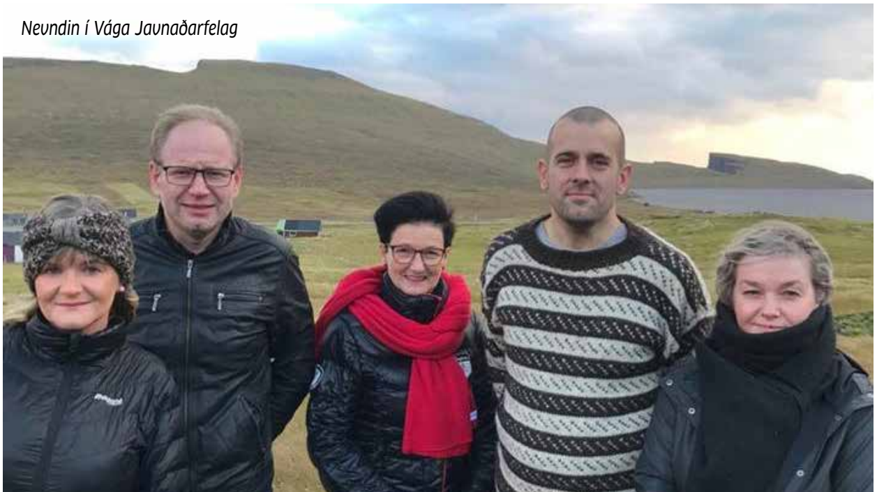
Nevndin í Vága Javnaðarfelag

Tá vit tosa um grønan politikk, er tað sum oftast vatn- og vindorka hugsað verður um. Men grønur politikkur er so nógv meira enn bara tað. Eitt nú innflyta vit fleiri tons av eplum og øðrum grønmæti árliga. Hettar er tó í minking, tí tað eru nógv eldsálir runt um í landinum, sum velja. Bæði tey, sum hava hetta sum hjávinna, og tey, sum velja til húsbúruk. Ynskiligt er, um enn fleiri fara at velja til húsbúruk, har ið umstøður eru til tað.