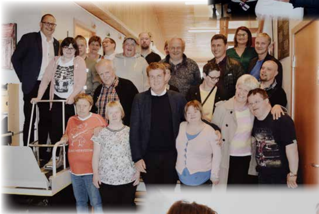
Á Stiggi í Saltangará vóru tey sera glað fyri vitjanina. Løgmaður fekk eitt stórt klemm