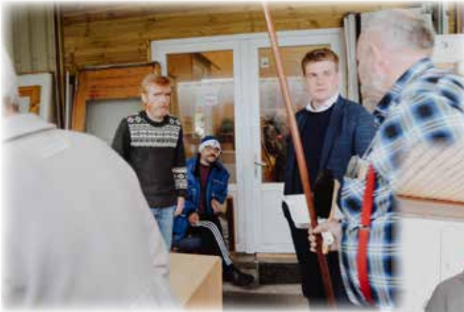
Dugni á Kambsdali