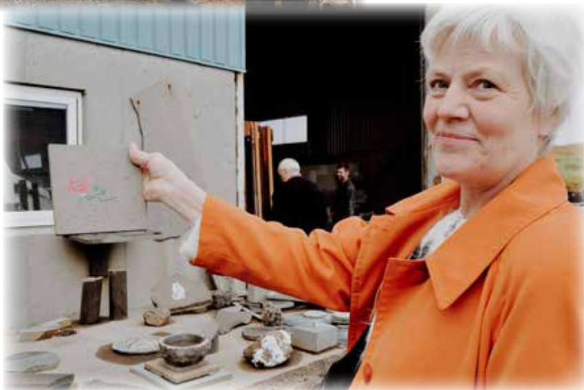
Tingbólkaforkvinnan uttan fyri Grótvirkið í Skopun.