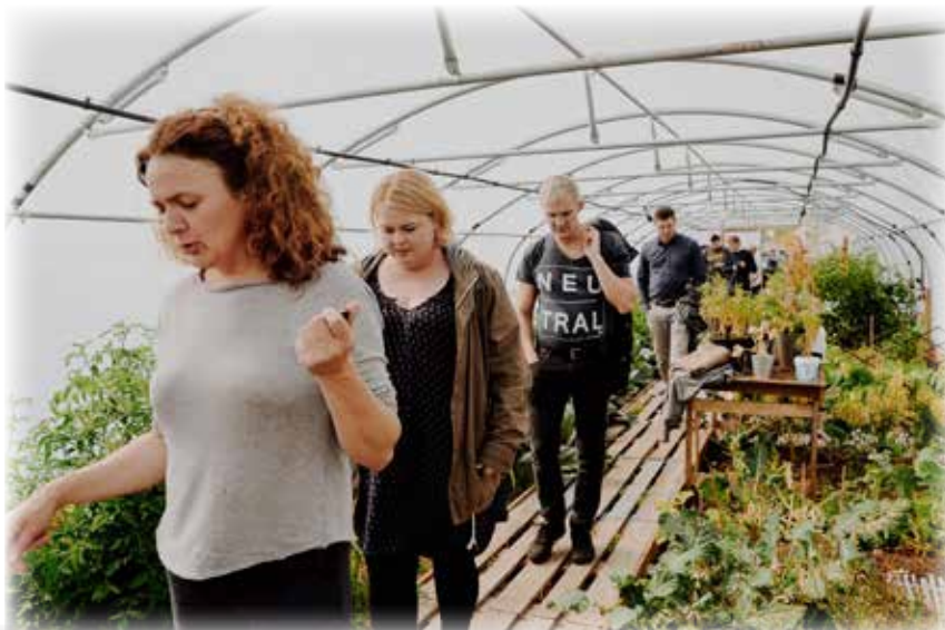
Inni í einum av tunlunum hjá Veltuni