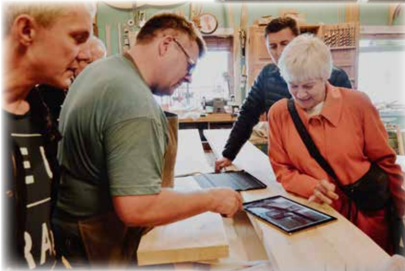
Inni í Snikkarakjallaranum í Dali.