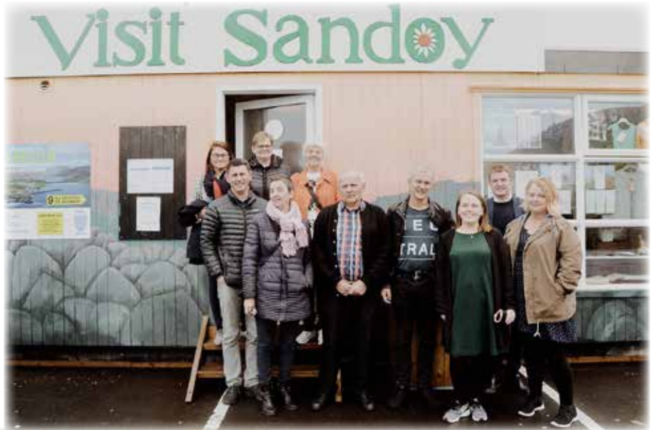
Uttan fyri kunningarstovuna í Skopun

Í Javnaðarflokkinum halda vit tað vera ómetaliga umráðandi, at vit javnan koma út um landið at vitja virkir og práta við fólk á staðnum. 14. august vitjaðu vit Visit Sandoy, Sandoy Seafood, Snikkarakjallaran í Dali, Hotel Skálavík, Veltuna í Skálavík og heima á Sandi og Føroya Grótvirki í Skopun. Sandoyingar tóku væl ímóti okkum, og við aftur á heimferðini høvdu vit nýggja vitan og íblástur til politiska arbeiðið - og eina rúgvu av grønmeti. Vit gleða okkum at koma aftur.