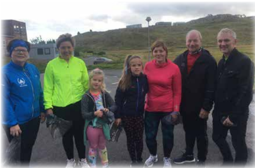
Nakað av tí, sum varð ruddað í høvuðsstaðnum