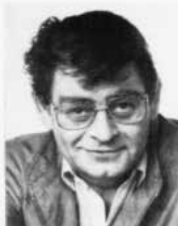
Atli P. Dam, lögmaður, Tórshavn