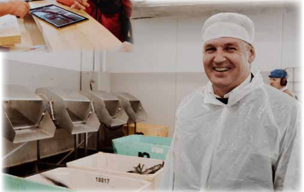
Formaðurin inni í Sandoy Seafood í Skopun.