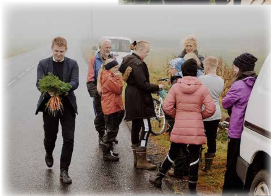
Formaðurinn hefur ógnað sær nakrar vistfrøðiligar gularøtur frá Veltuni.