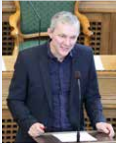
SKRIVAÐ HEVUR: SJÚRÐUR SKAALE